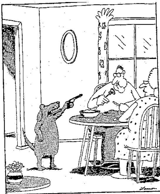
"Эй, болван... Я устал попрошайничать"

Просмотрите шаг 2; большинство людей, попытки которых произвести изменение не имели успеха, не смогли найти для этого достаточно сильного рычага. Возможно, вам необходимо взять на себя публичное обязательство для того, чтобы усилить действие рычага. Сделайте это перед людьми, которые не дадут вам "сорваться с крючка"!